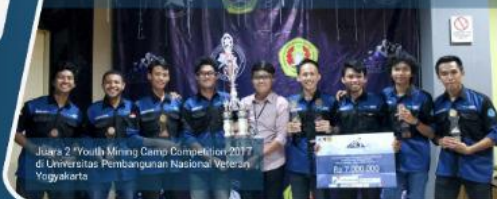
Juara 2 "Youth Mining Camp Competition 2017" di Universitas Pembangunan Nasional Veteran Yogyakarta

Proud to Be & Mine Entrepreneur & Mine Engineer