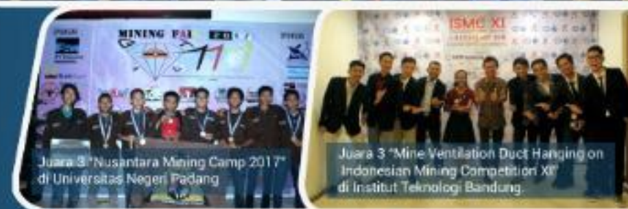
Juara 3 "Nusantara Mining Camp 2017" di Universitas Negeri Padang